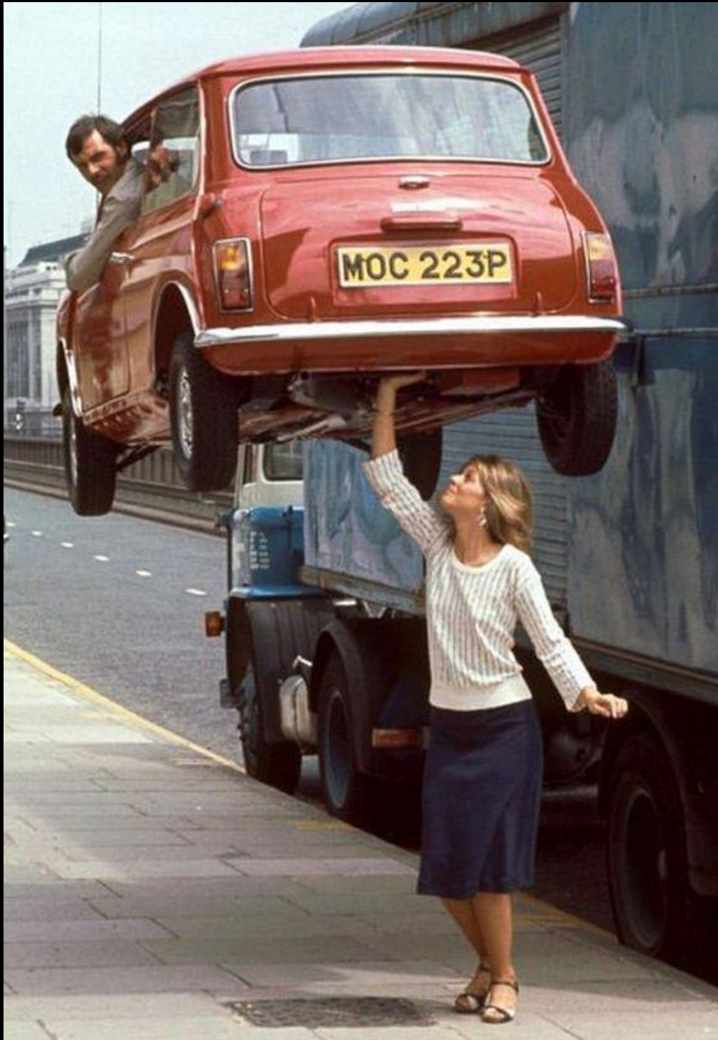
Quero ver! Essa é do Fotógrafo Ninja. Traduz!!!!