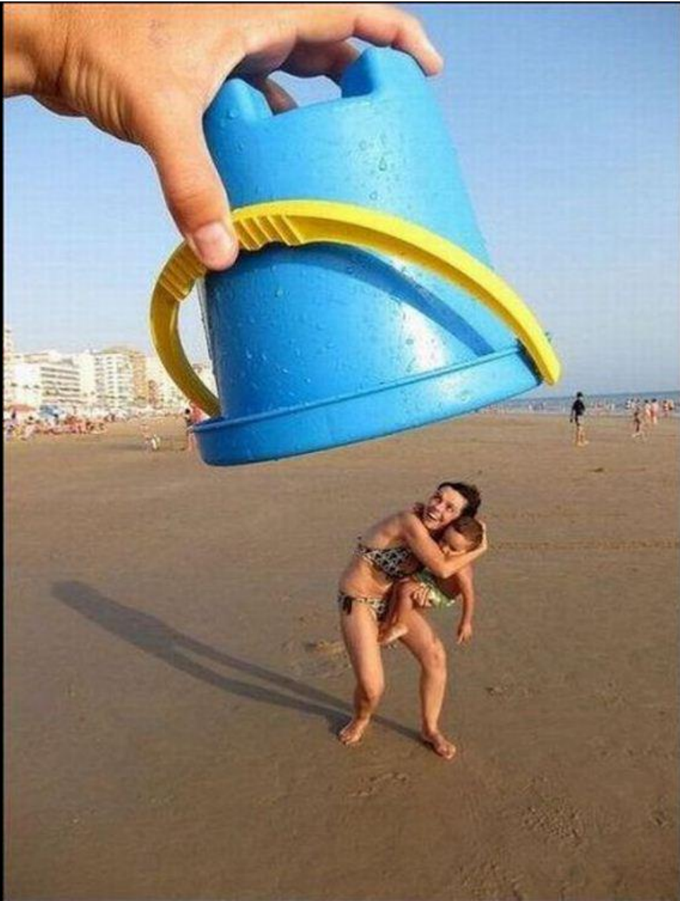
Fotógrafo Ninja. Adoro essas fotos!